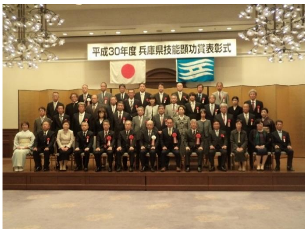
平成 30 年度 兵庫県技能顕功賞表彰式