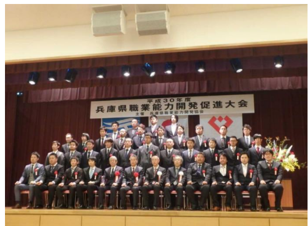
平成 30 年度兵庫県職業能力開発促進大会(青年優秀技能者表彰)